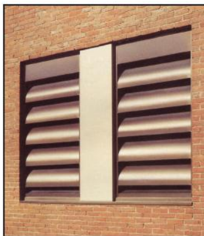
משתיקי רעש רפפות בחדרי מכונות